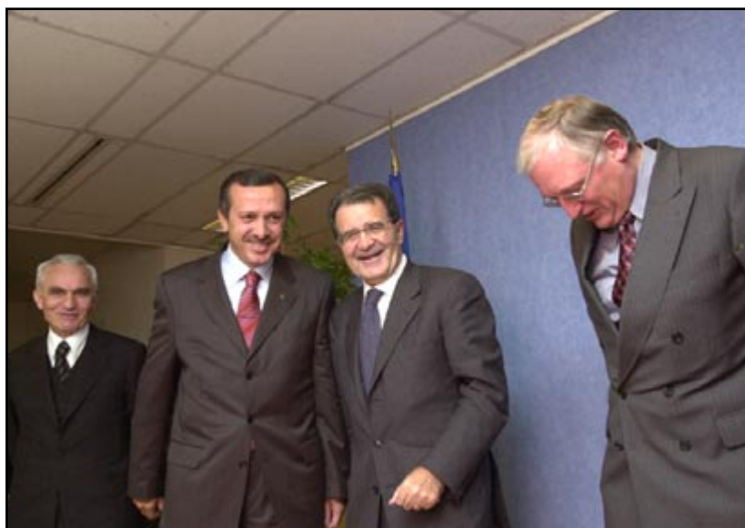
Yasar Yakis og Recep Erdogan mødes med Romano Prodi og Günter Verheugen

Afskaffelse af dødsstraf har været et kardinalpunkt i Kommissionens kritik af Tyrkiet og samtidig været en politisk varm kartoffel i Tyrkiet. En af årsagerne til dette var, at lederen af det kurdiske arbejderparti PKK,