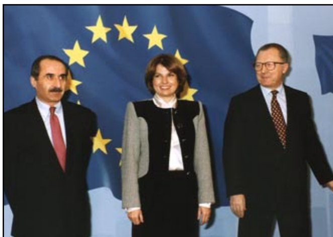
Hikmet Cetin og Tansu Ciller sammen med Jacques Delors

Tiden efter Den Kolde Krigs afslutning har i Tyrkiet været præget af store samfundsproblemer såsom ustabil økonomi, korruption og en voksende islamisering af civilsamfundet. Politisk kom det islamisk-orienterede parti, Velfærdspartiet, til at dominere, og i 1996 og frem til militærets intervention i 1997 var Tyrkiet ledet af partiets leder, Necmettin Erbakan, med Tansu Ciller (Ciller bestred i øvrigt som den første kvinde præsidentposten i 1993-1995) fra Den Rette Vejs Parti som vicepremierminister og udenrigsminister. Militæret pressede Erbakan til at gå af, fordi det mente, at han og hans parti havde handlet mod Tyrkiets grundlovsfæstede sekulære principper og i øvrigt ikke været i stand til at løse Tyrkiets samfundsproblemer. Erbakan selv blev udelukket fra politik i fem år, og partiet blev lukket.