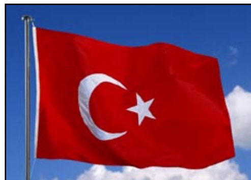
Det tyrkiske flag